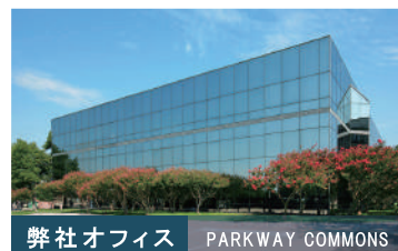
弊社オフィス PARKWAY COMMONS